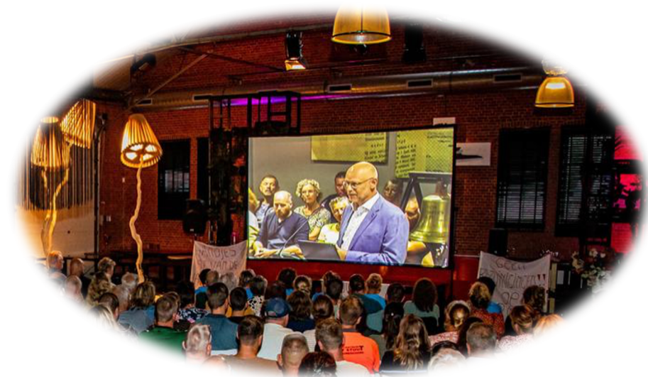
Toelichting advies aan raad en burgers gemeente Oldambt 2022

2000 – heden Eigenaar Borca Consult (zelfstandig ondernemer) 2017 – 2022 Directielid Stichting Ateliers MTW (1 dag p/w) 1989 – 2000 Diverse functies in loondienst